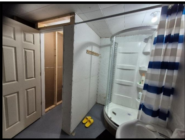
공사 후 화장실 및 샤워실 (우측) VBS에 참여중인 원주민 아이들과 선교팀