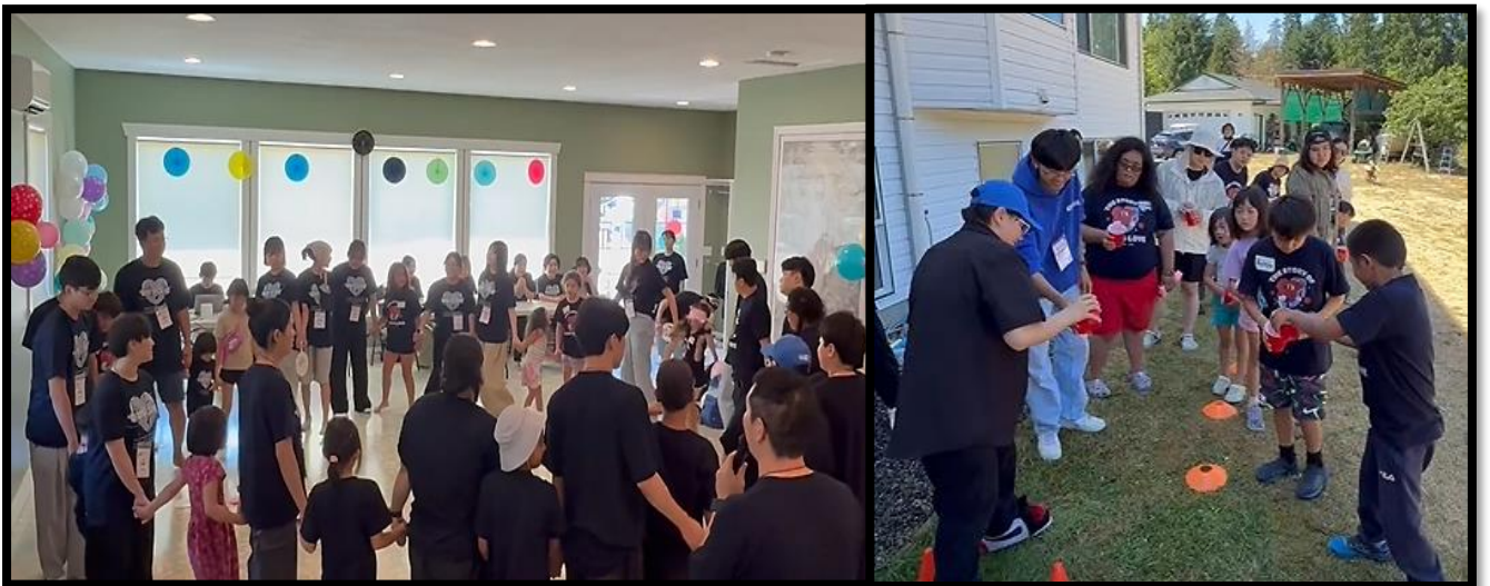
2025 VBS에 참여하는 나나이모원주민교회 아이들과 선교팀

세 겹 줄이 끊어지지 않는 것처럼 하나님의 선교도 물심양면으로 도와주시고 기도로 연합해주시는 동역자 여러분으로 인하여 더욱 풍성해지고 견고해져 갑니다. 하나님 나라를 위해 소중한 시간과 재정, 사랑으로 함께 하신 선교팀께 진심으로 감사드립니다.