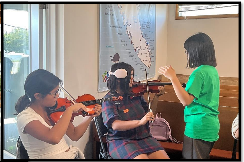
어린이 음악캠프에서 바이올린을 배우는 원주민 어린이