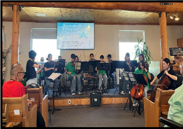
원주민 초청 여름 음악콘서트

뜨거운 여름날 복음의 열정을 가지고 원주민을 향하여 드렸던 여러분의 모든 섬김을 주님께서 기억하고 기뻐 받으실 것입니다. 이것이 씨앗이 심겨지는 작업이든, 물을 주는 작업이든 순종을 드렸으니 하나님께서 당신의 때에 자라게 하심을 믿습니다.