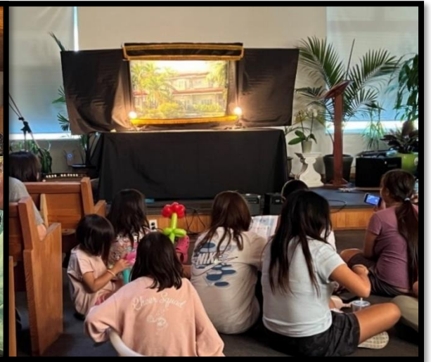
커뮤니티 디너 후 복음인형극을 보는 원주민성도들