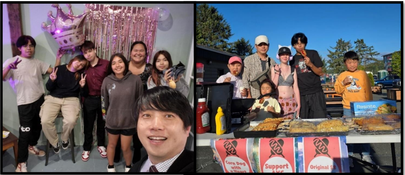
포트하디 원주민 청소년 예배

과치노 마을의 귀한 아이들과 원주민을 섬길 동역자님을 위해, 또 졸업한 아이들이 방황하지 않고 주님의 비전을 발견하도록, 심령이 갈급한 원주민들이 주님을 만나도록 함께 기도해주세요.