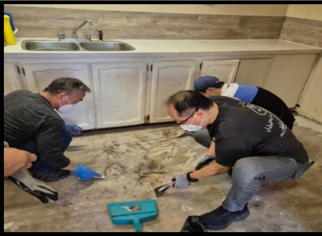
주방 공사중인 성전 보수 선교팀

금번 여름성경학교를 통해 만난 아이들과 가정이 교회로 인도되고 주일학교가 성장하도록, 코모랜트섬의 복음화를 위해 힘차게 쓰임 받는 글래드타이딩스교회 선교팀이 되도록, 또 전기공사와 난방공사까지 보수공사가 잘 마무리되도록 지속적으로 기도 부탁드립니다.