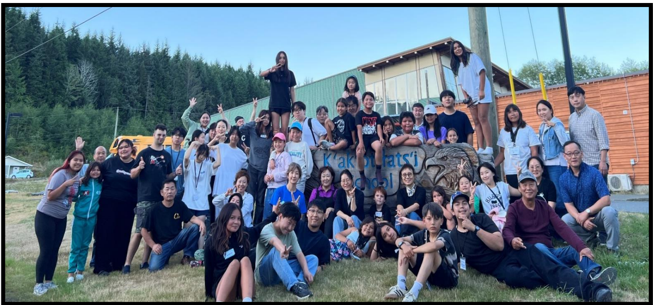
과치노 마을에서 열린 VBS에 참가한 인근지역 다음세대와 선교팀