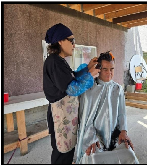
미용봉사로 섬기는 선교팀