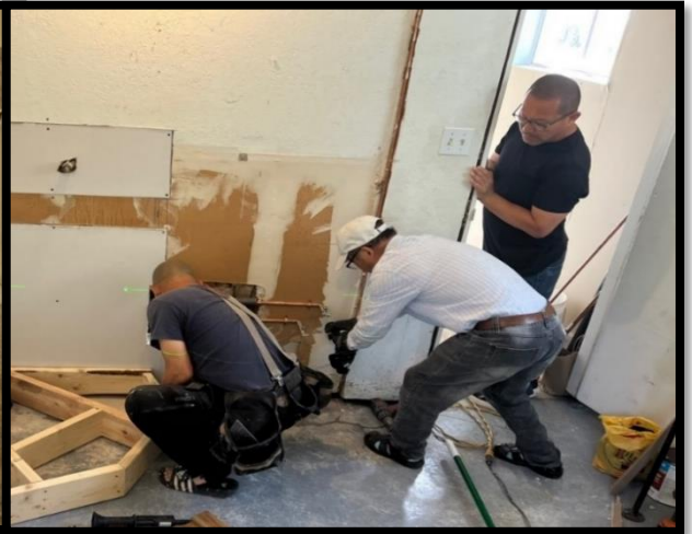
지하1층 화장실 공사중인 선교팀