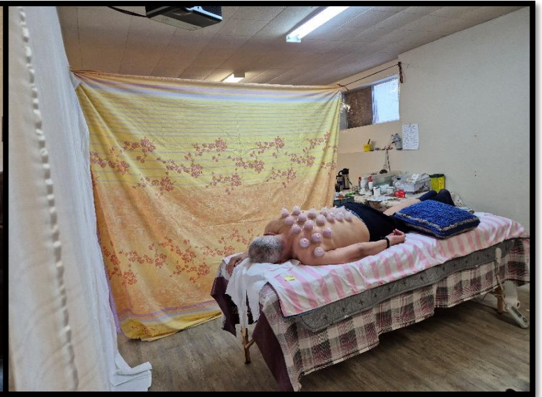
한방 시술을 받고 있는 글래드타이딩스교회 성도님