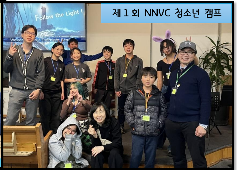
제 1 회 NNVC 청소년 캠프

[커뮤니티 디너, 미용한방봉사] 3월 8일에는 원주민성도님과 푸드뱅크에서 연결된 분들을 초청하여 커뮤니티 디너와 한방 침술 및 미용봉사로 섬겼습니다. 예수님의 사랑과 은혜로 저들의 영혼이 채워지고, 위장이 채워지며, 아픈 육신이 치료받는 위로의 시간이었습니다.