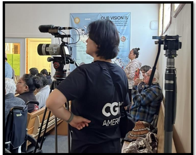
원주민 주일예배를 촬영하는 CGN TV 미션로그 제작진

오직 선하신 하나님의 뜻만 이뤄지고 예수님의 생명이 흘러가는 153선교회가 되도록, 그 부르심의 길을 진실하고 성실하게 달려갈 수 있도록 함께 기도해 주십시오.