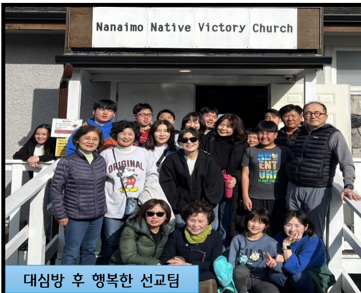
대심방 후 행복한 선교팀

모든 저주와 사망을 이기신 예수 그리스도의 부활이 원주민성도님들의 영혼육을 살리고 구원과 새생명의 역사로 이어지도록, 저들이 즐겨하던 세상의 중독과 저주에서 벗어나 예수님의 사랑에 깊이 잠겨 구원받도록, 믿음안에 살아가도록 함께 기도하여 주십시오.