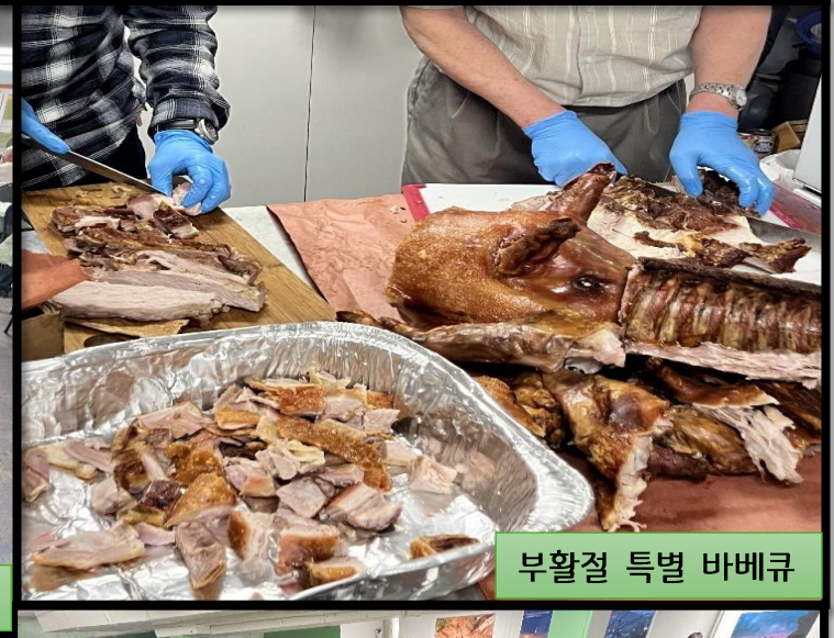
부활절 특별 바베큐