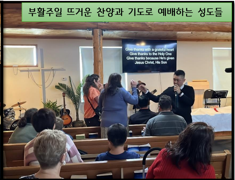
부활주일 뜨거운 찬양과 기도로 예배하는 성도들