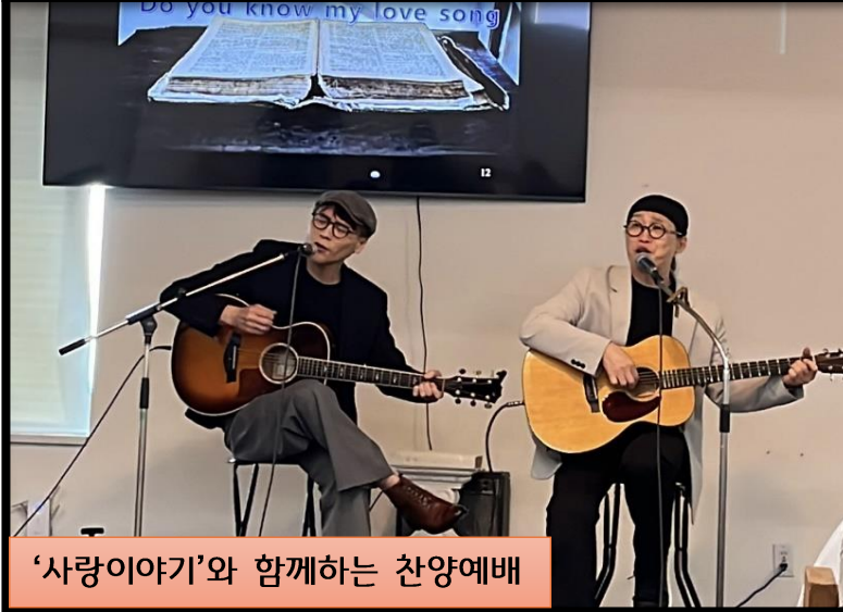
'사랑이야기'와 함께하는 찬양예배