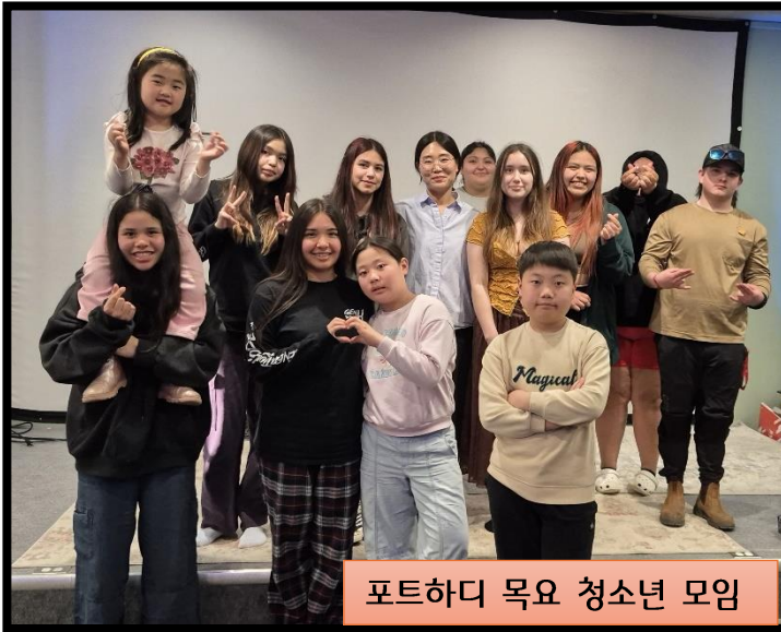
포트하디 목요 청소년 모임

원주민 마을(과살라,과치노)마다 교회 처소가 마련되도록, 원주민 다음세대들 그리고 리더와 동역자가 세워지도록 함께 기도해주십시오.