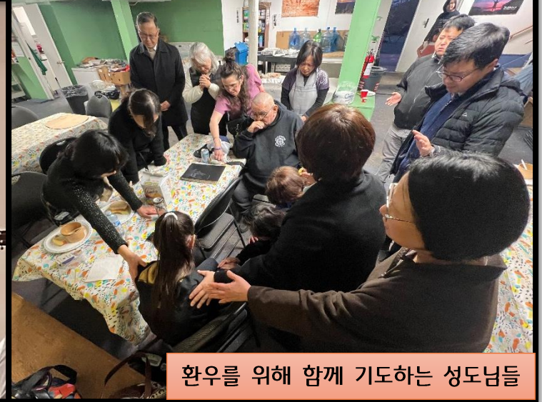
환우를 위해 함께 기도하는 성도님들