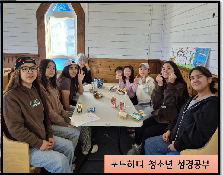
포트하디 청소년 성경공부