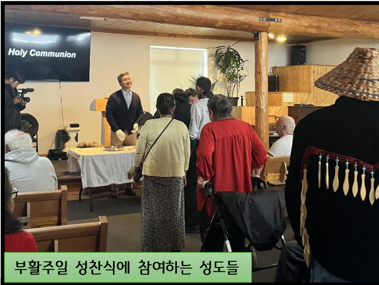
부활주일 성찬식에 참여하는 성도들