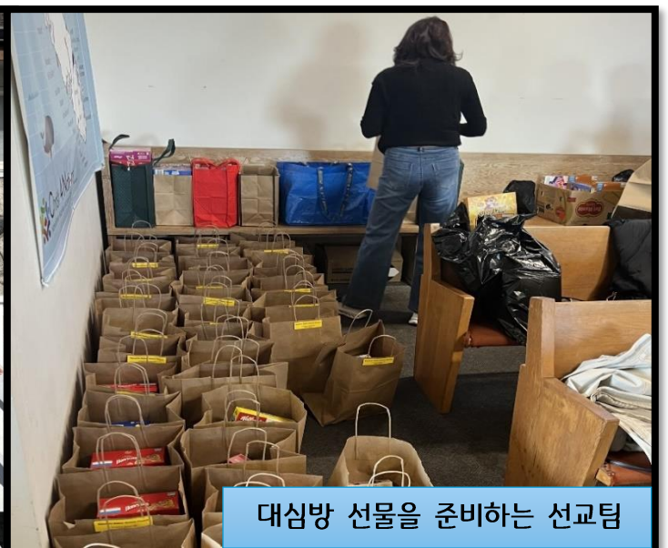
대심방 선물을 준비하는 선교팀