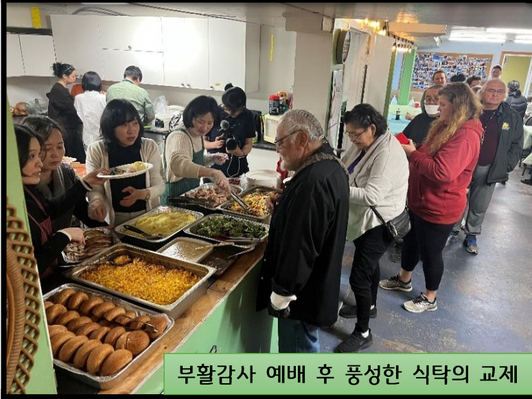
부활감사 예배 후 풍성한 식탁의 교제